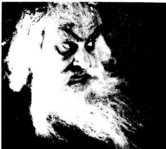
Αἰμίλιος Βεάκης, 1939

πάνω στή σκηνή, τήν ημέρα διάβαζε, ἔγραφε θεατρικά ἔργα, ποιήματα, δίδασκε στίς δραματικές σχολές, ἀγωνιζότανε μέ τό στίχο, μέ τήν πένα, ὄρθιος πάνω στίς πνευματικές ἐπάλξεις καί στίς παραδόσεις αὐτοῦ τοῦ λαοῦ, ἀσυμβίβαστος μαχητής τῆς λευτεριάς.