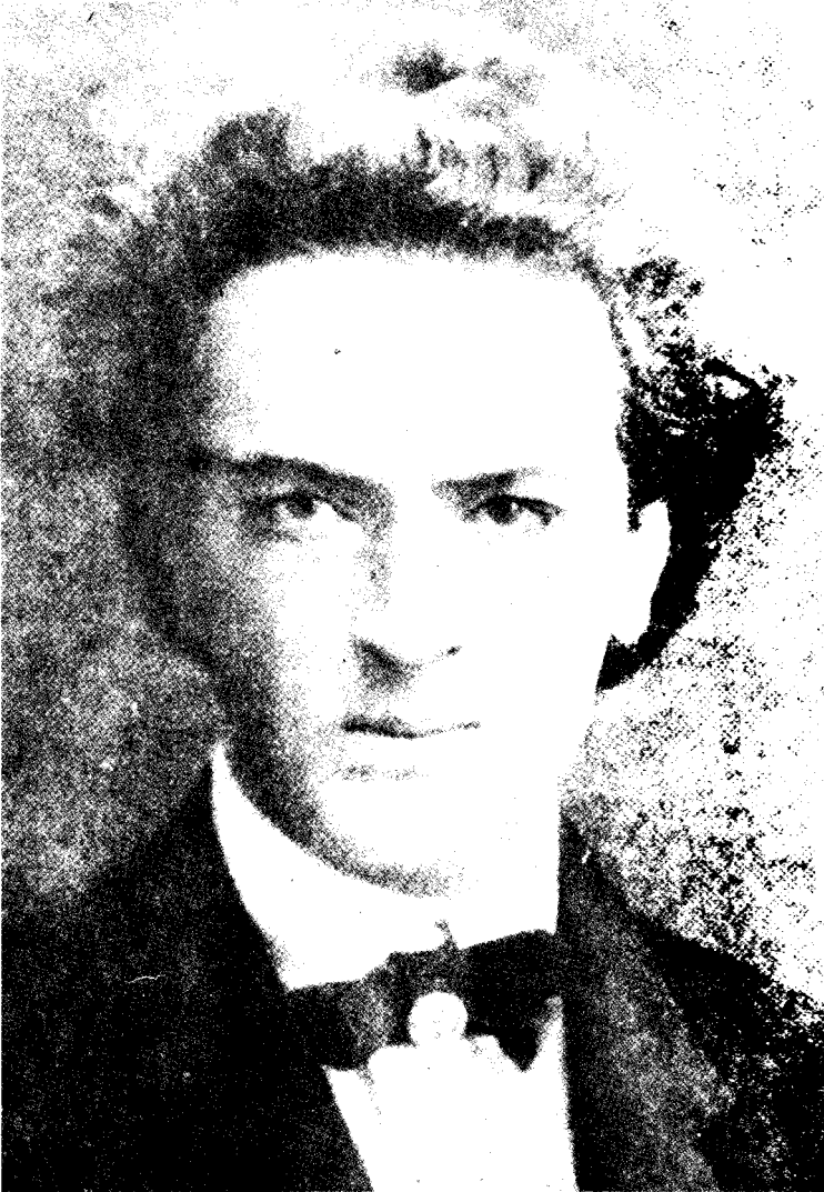
Ό Σικελιανός τó 1908