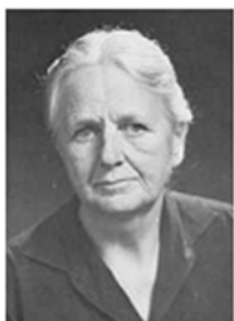
(1903 – 1983) Joan Robinson

Για την περιγραφή και εξήγηση τέτοιων αποφάσεων χρησιμοποιείται τυπικά μια συγκεκριμένη μορφή μοντέλου ατόμων που αποφασίζουν, καθώς και των καταστάσεων, για τις οποίες πρέπει να ληφθεί απόφαση. Τα μοντέλα αποτελούν αφαιρετική αποτύπωση της (οικονομικής) πραγματικότητας. Αφαιρετική υπό την έννοια, ότι δεν μπορούν να ενταχθούν σε αυτό όλες οι παράμετροι που διαμορφώνουν την πραγματικότητα. Όπως ανέφερε και η αγγλίδα οικονομολόγος Joan Robinson (1903–1983)